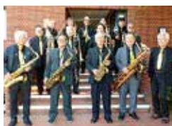
Sweetfish Jazz Orchestra(厚木)