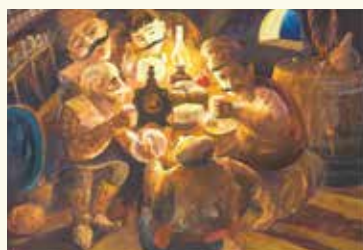
第23回 大賞『もてなし』(モルドバ共和国)

世界71の国と地域及び神奈川県内と全国の外国人学校から集まった10,743点の中から入賞した作品の一部を展示します。世界中の子どもたちのエネルギーあふれる作品の一つひとつから、世界と私たちのつながりをぜひ感じてください。