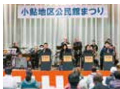
ビッグエイト ジャズオーケストラ(厚木)