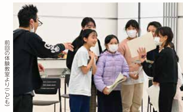
前回の体験教室より(子ども)