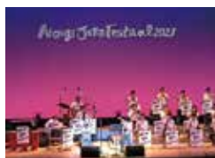
Swing Medical Jazz Orchestra(相模原)