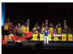
JAZZ ENSEMBLE 阿夫利(伊勢原)