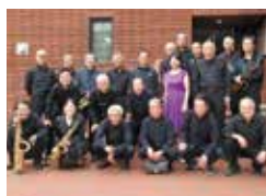
ビッグハードオーケストラ (秦野)