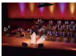
ZAMAビッグバンド ジャズオーケストラ(座間)