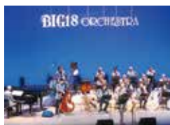
Big18オーケストラ (厚木・大和)