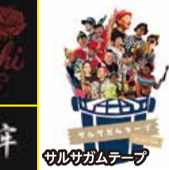
サルサガムテープ

主催：ATSUGI Hi! Thunder ROCK FES 実行委員会 (NPO法人ハイテンション、Thunder Snake ATSUGI、(公財)厚木市文化振興財団) 協賛：厚木伊勢原ケーブルネットワーク株式会社、株式会社イー・エス・ビー、 海老名エフエム放送株式会社、株式会社 志智創健、フジゲン株式会社、ホンアツ酒場 協力：狛江ラジオ放送株式会社