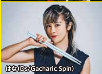
はな (Ds/Gacharic Spin)