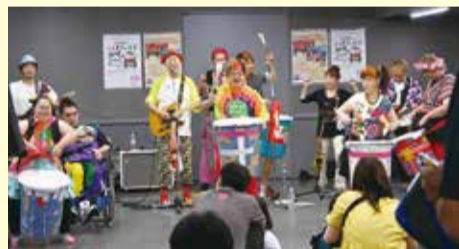
忌野清志郎に「ロックの原点」と称されたロックバンド・サルサガムテープによるスペシャルライブ!